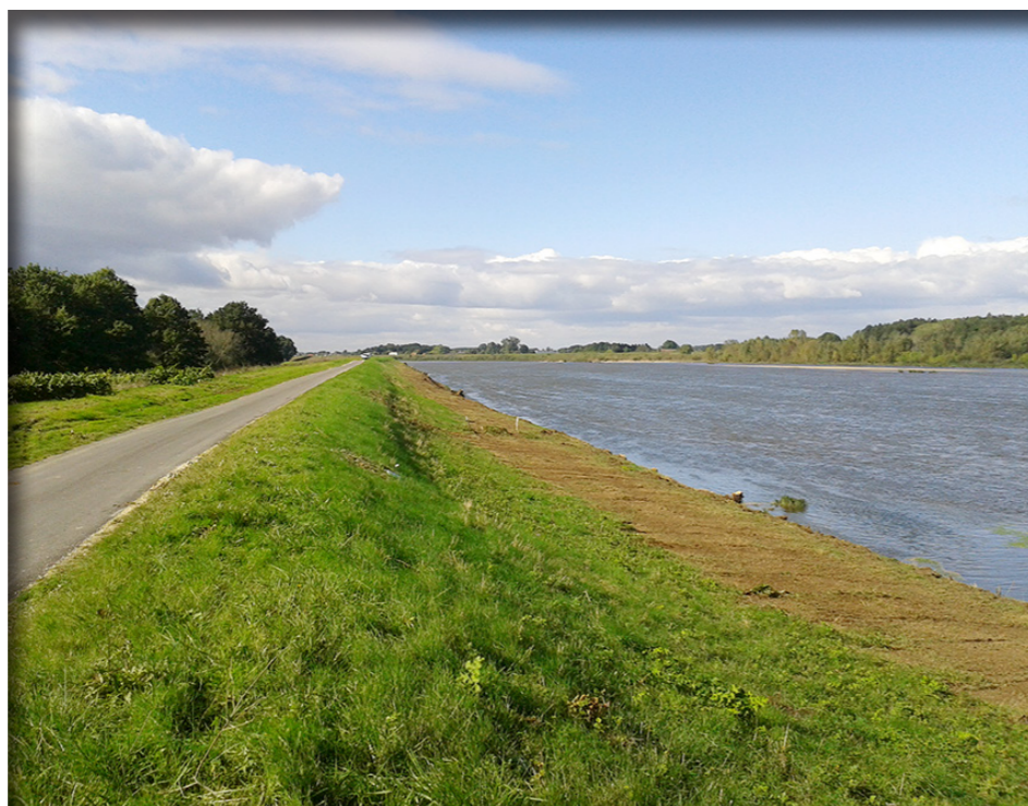
Digue de Sully-sur-Loire

Les résultats exposés précédemment sont obtenus par des modèles mathématiques (hydraulique, géotechnique, aléas de rupture,...), et de l'état de la connaissance scientifique ■